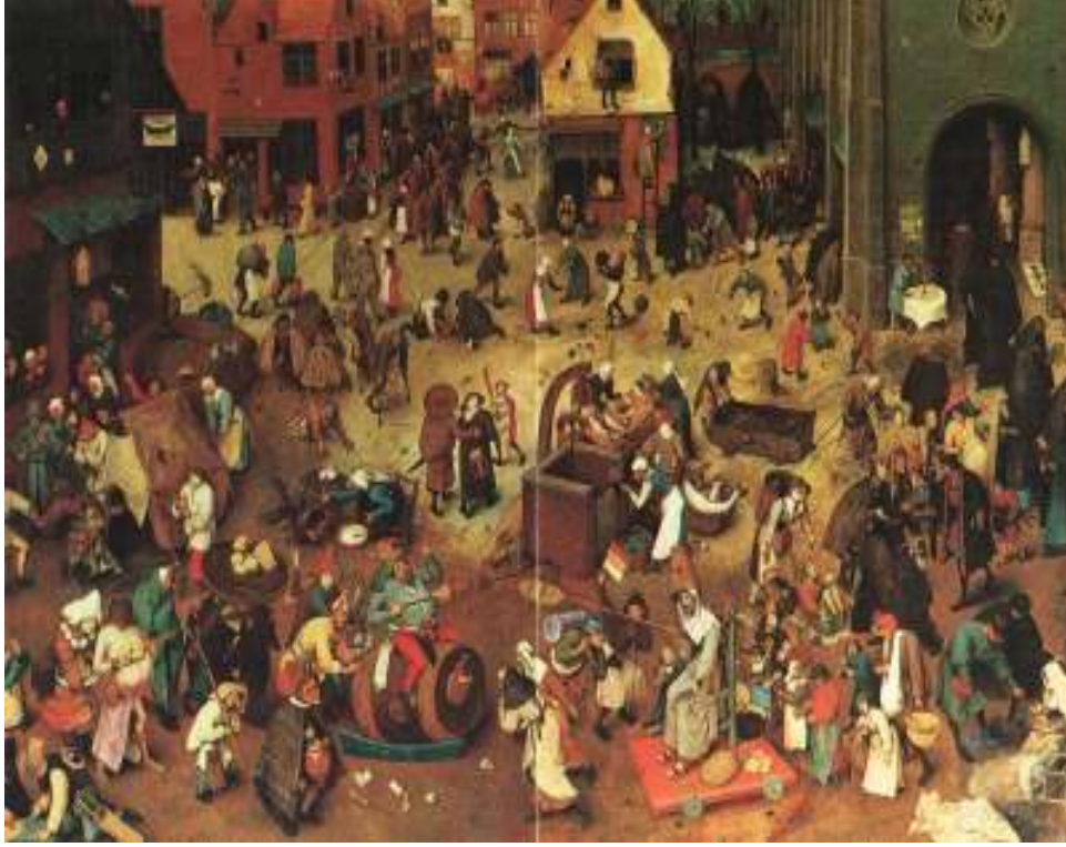
شكل رقم (٤)