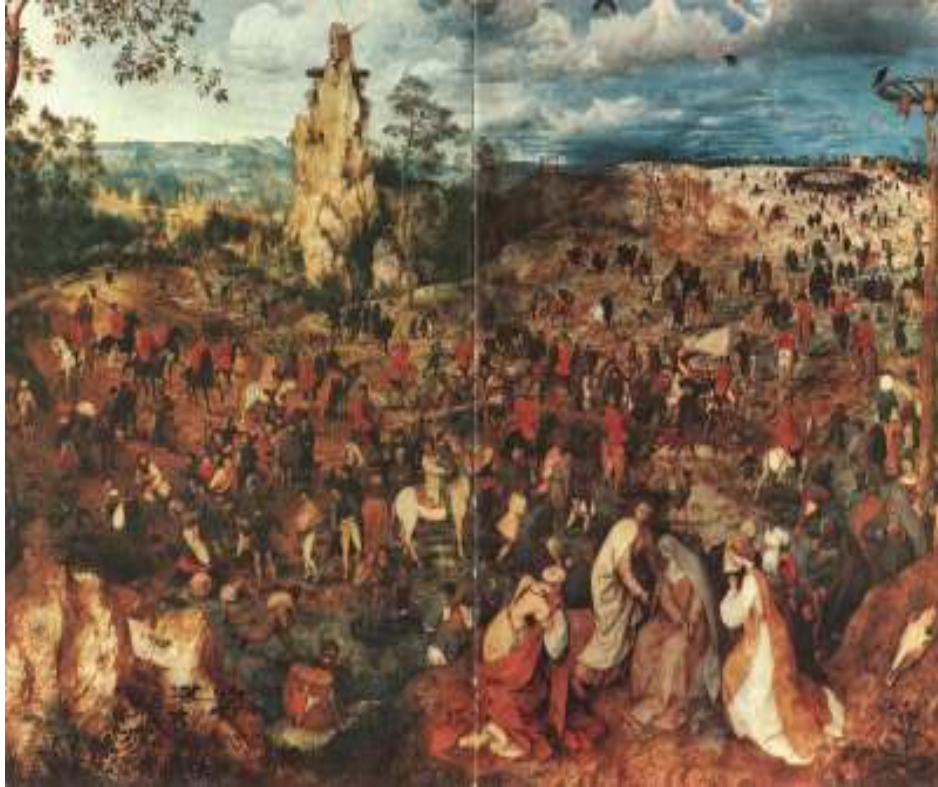
شكل رقم (٦)