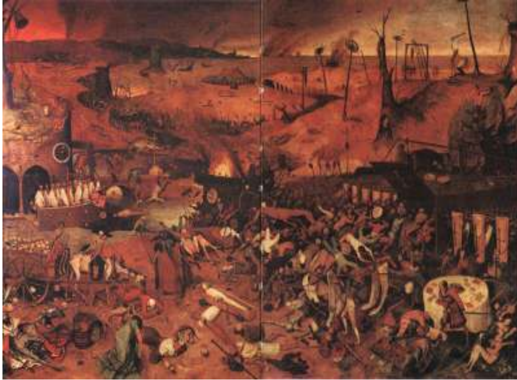
شكل رقم (٥)