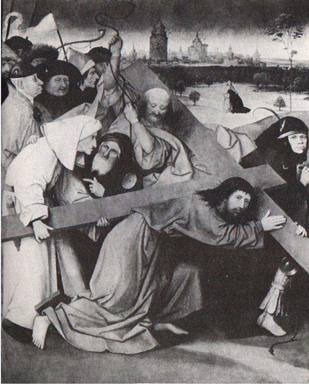
شكل رقم (٣)