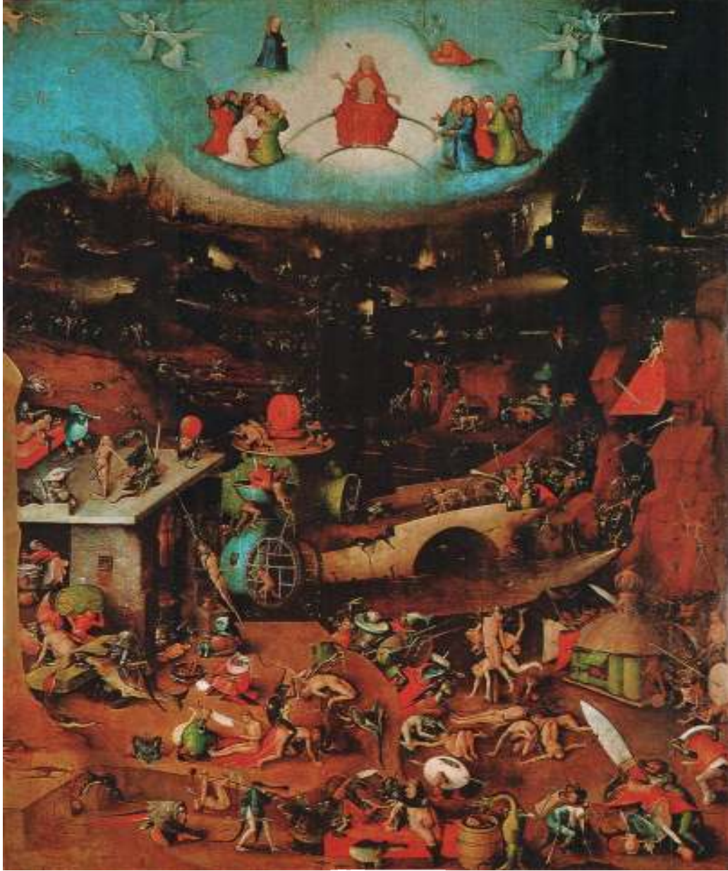
شكل رقم (٢)