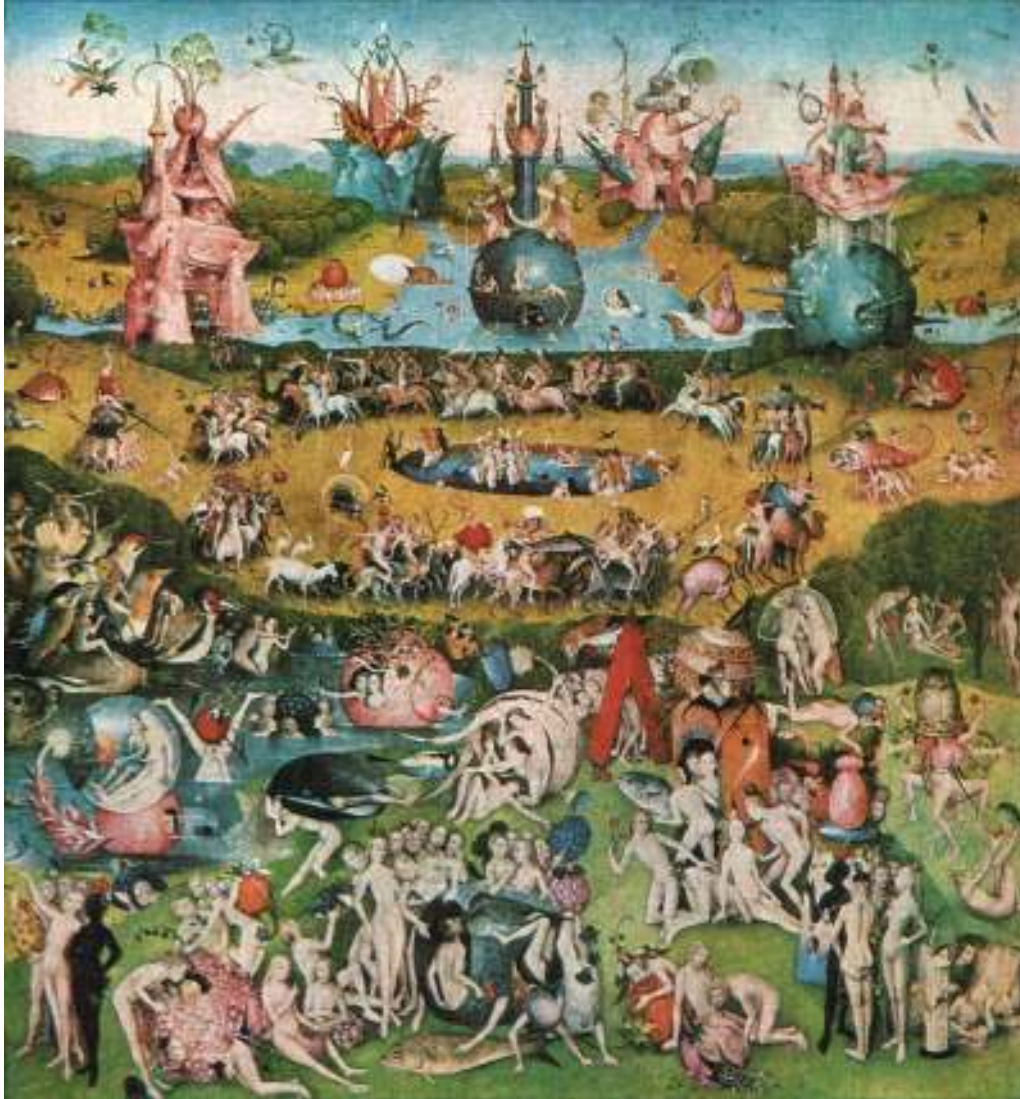
شكل رقم (١)